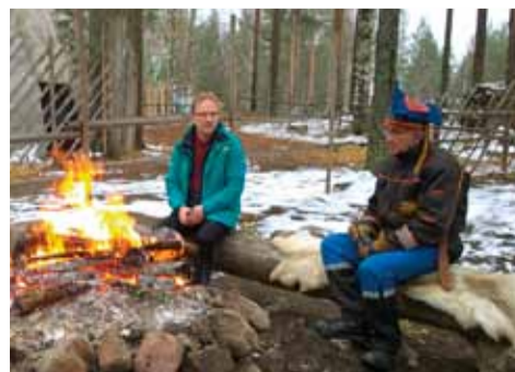
Pohjois-Suomi ja Lappi ovat sydäntä lähellä olevia paikkoja. Vapaa-ajan täyttää myös seurakunnan luottamustehtävät Vesilahdella.