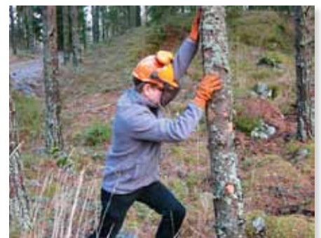
Metsänhoito ja rakentaminen suosikkiharrastuksina pitävät hyvää kuntoa yllä.